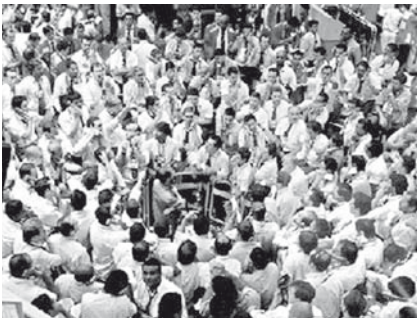
Derivative population in global financial markets. A debate at the agora of the econocity. Derivatpopulation in globalen Finanzmärkten. Debatte auf der Agora der Econocity.

Like a biofilm in which microorganisms exist, the globalizing economy forms a paradigmatic field of existence, an “econofilm” as it were, in which individuals are embedded. Body and society are increasingly defined economically, as “business” corporations that act globally, that is, above and beyond political bodies like states, as utilizable social forms, from the listed stock company to the now integrated individual beings of individual business initiatives. To guarantee this embedding in the econocity, the project of a global economy and of companies is not nearly capable of accepting a person truly as an individual, or society as a political project, despite declarations to the contrary. They cannot afford to do so if they take their self-preservation in the econofilm seriously.