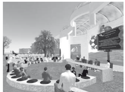
Derivative population in virtual space. Self-colonization in virtual space. Derivatpopulation im virtuellen Raum. Selbst-Kolonialisierung im virtuellen Raum.